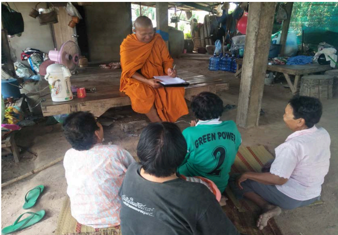
สัมภาษณ์กลุ่มชาวบ้านทั่วไป เมื่อวันที่ ๑๓ มกราคม พ.ศ. ๒๕๖๒