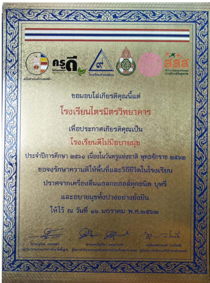
รางวัลโล่เกียรติคุณของโรงเรียนในชุมชนบ้านโนนเขวา