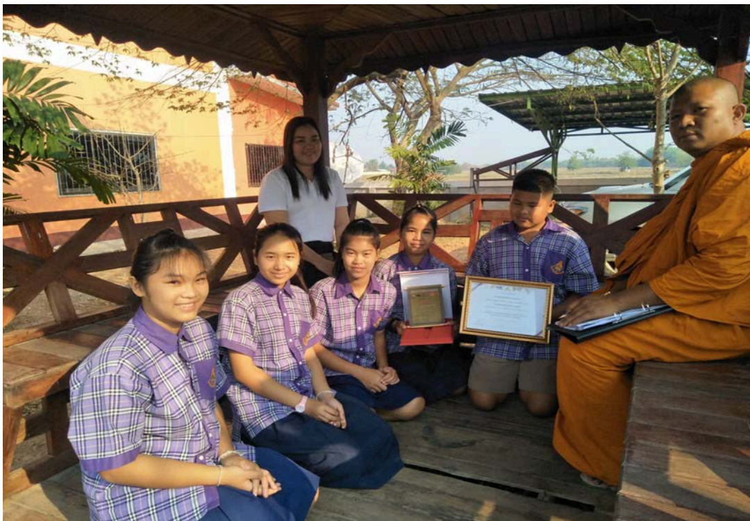
สัมภาษณ์เยาวชนอายุ ๑๐ ปีขึ้นไป กลุ่มที่ ๑, เมื่อวันที่ ๑๓ มกราคม พ.ศ. ๒๕๖๒